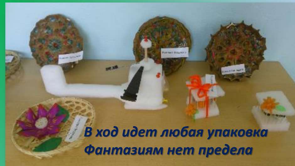
В ход идет любая упаковка Фантазиям нет предела