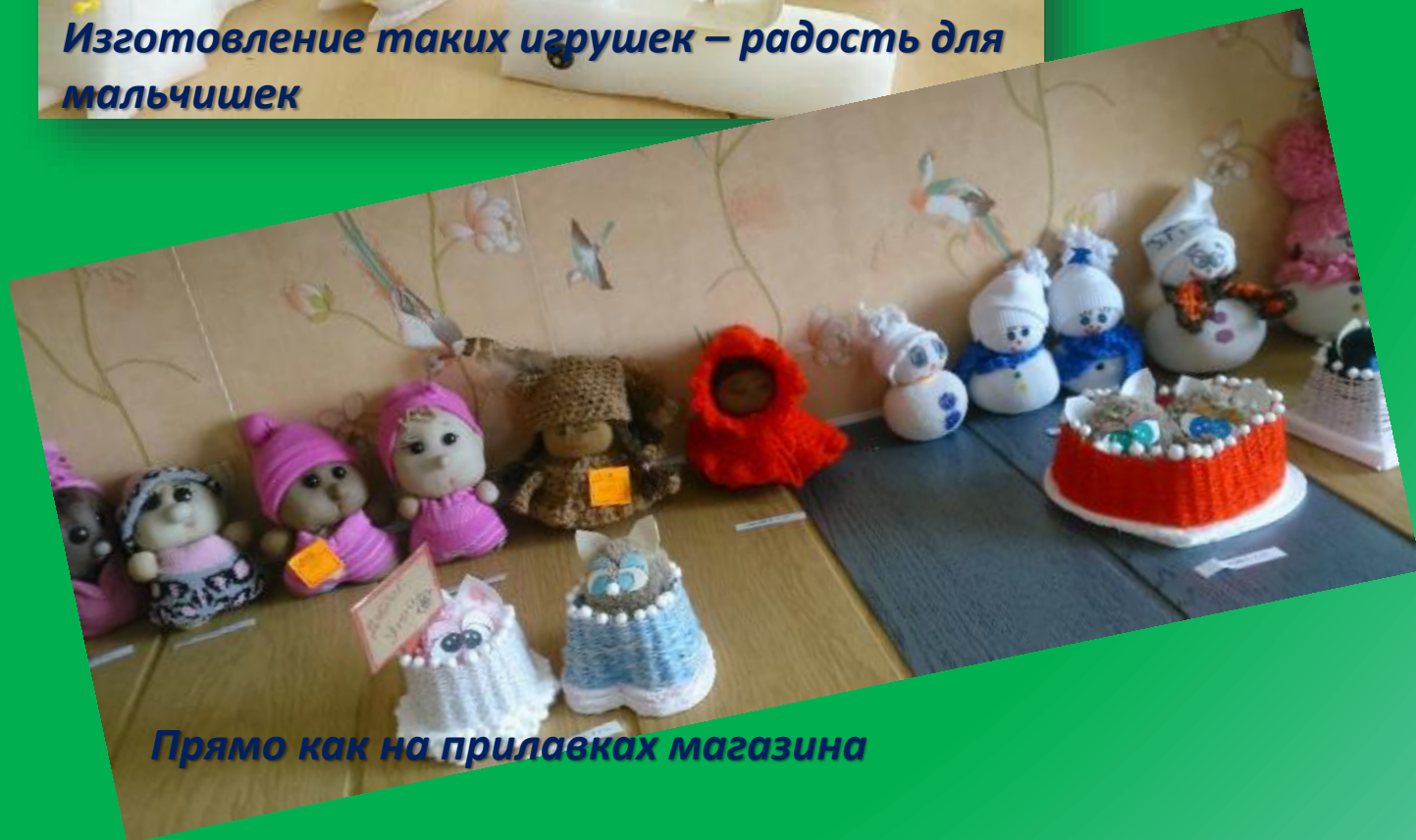
Прямо как на прилавках магазина