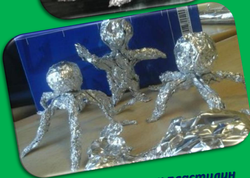
И фольга, как пластилин