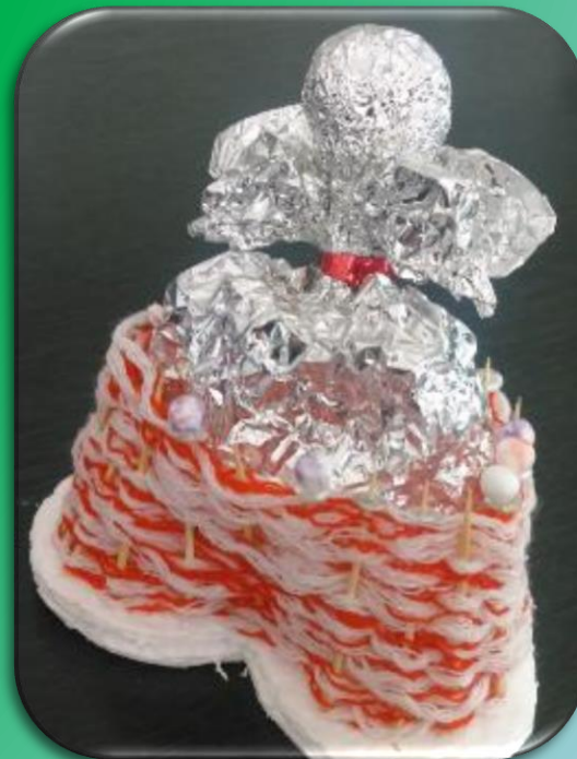
Ангелочек в шкатулке