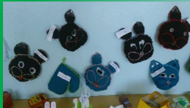
Прихватки из старых драповых пальто. Мамы были очень рады