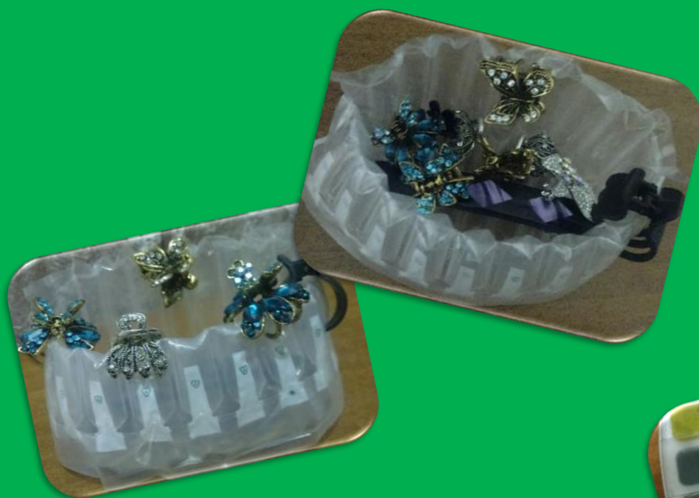
Упаковка для картриджей – удобный ларец для девичьих заколок для волос