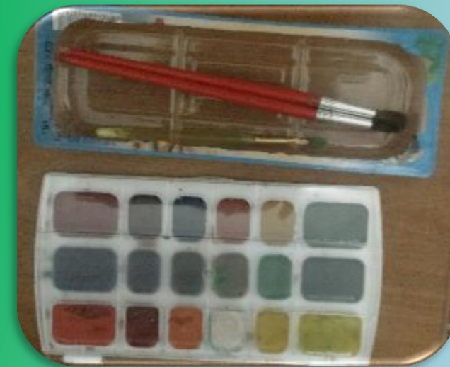
Удобная коробочка для хранения кисточек