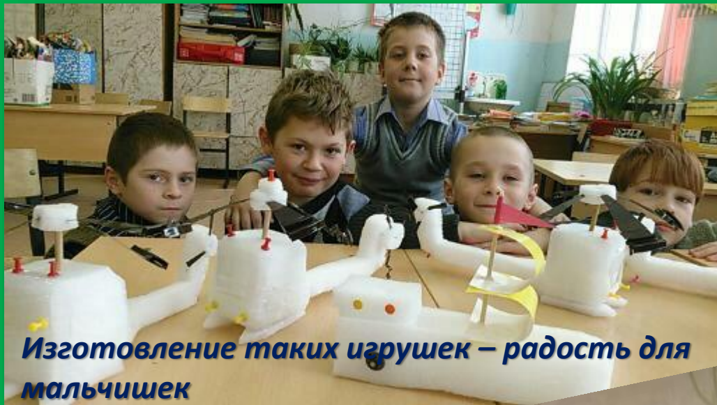
Изготовление таких игрушек – радость для мальчишек