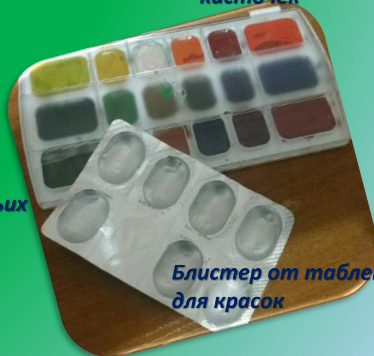
Блистер от таблеток служит палитрой для красок