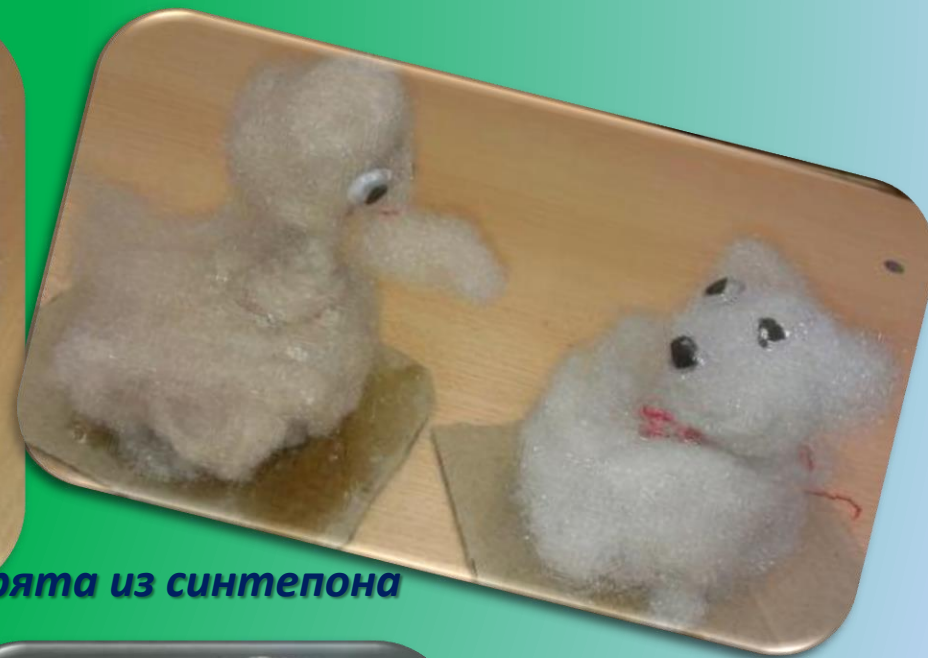
Игрушки из синтепона