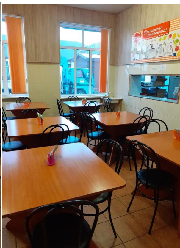
Школьные завтраки и обеды